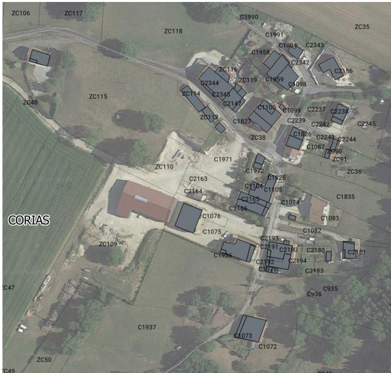
Vue aérienne du secteur